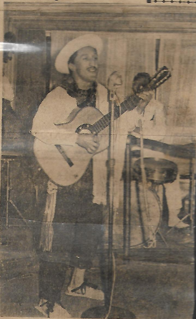
El cantante colombiano Torres Molina, en una de sus últimas actuaciones